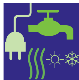
Plomberie / Electricité Chauffage / Isolation Climatisation

Merci de renvoyer le dossier complet au service des prêts de l'agence la plus proche