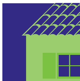
Façades / Toitures Fenêtres